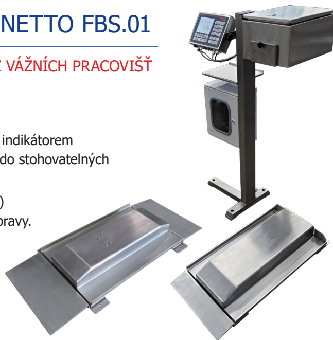
obousměrná (se dvěma nájezdy)

Možnost připojení druhého vážícího můstku pro vážení objemnějších objednávek (paletová, podlahová nebo visutá váha).