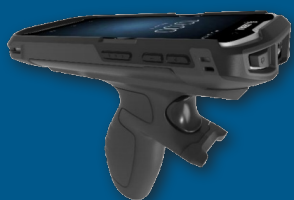
Mobilní terminál ZEBRA TC52 v pistolovém provedení