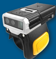
Prstencová čtečka čárových kódů ZEBRA RS5100