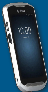
Mobilní terminál ZEBRA TC52